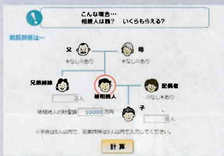
相続人は誰?いくらもらえる? (図1)